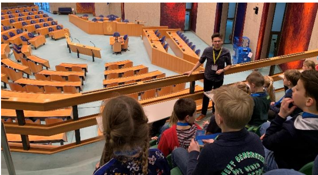
Groep 6 & 7 tijdens hun excursie naar De Tweede Kamer

Onze overheid stimuleert leerlingen om De Tweede Kamer te bezoeken en te horen hoe ons land bestuurd wordt. Voor de basisschool is een les ontworpen door Pro Demos en zij geven hiermee uitvoering aan deze wens. Onze school bezocht op 8 januari Den Haag. Eerst was daar in Madurodam een les over ons democratisch kiesstelsel. De leerlingen vormden politieke partijen en werd gevraagd standpunten in te brengen met betrekking tot de inrichting van 'Democracy'. Welke gebouwen en voorzieningen wilden zij plaatsen? Welke argumenten wisten zij hiervoor te geven? Na het houden van een stemming werd besloten of een plan wel of niet zou worden uitgevoerd. Het bezoek aan De Tweede Kamer vormde de afsluiting van de bijzondere les.